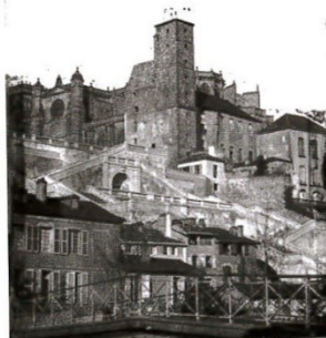
L'escalier peu après sa construction et la passerelle Saint-Pierre en bas (Photographie Eugène Tindal, après 1863)

Tout d'abord s'imposait la démolition du quartier de la chanoinie, actuelle place Salinis. Il s'agissait des restes du cloître et d'une série de maisons individuelles inoccupées et en mauvais état. Les chanoines, issus de la bonne société auscitaine, logeaient ailleurs plus luxueusement. Cette place constituerait un beau balcon sur le Gers et la basse ville. Mais que faire des gravats? Et si l'on créait une liaison piétonnière entre la haute et